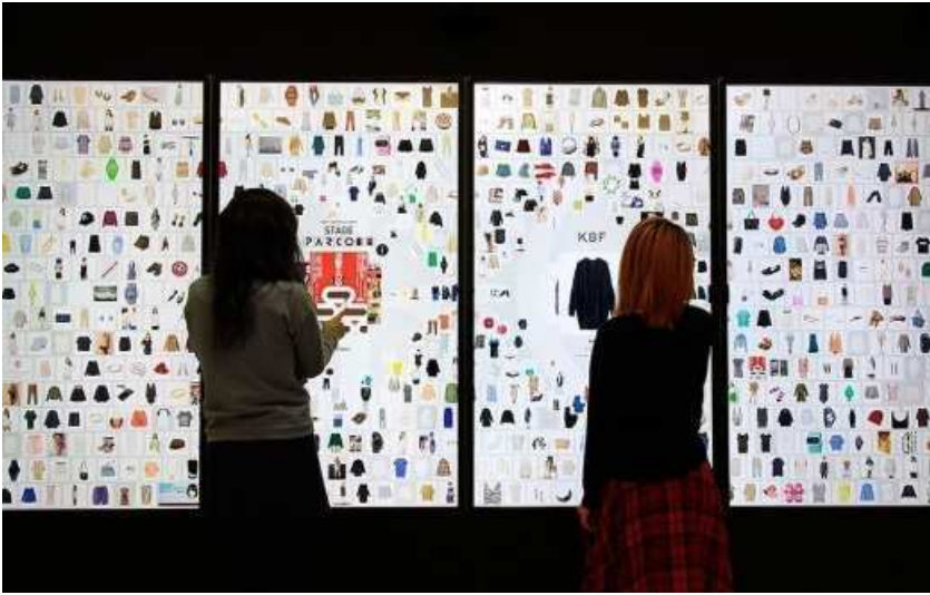
팀랩이 고안한 디지털 플로어 가이드