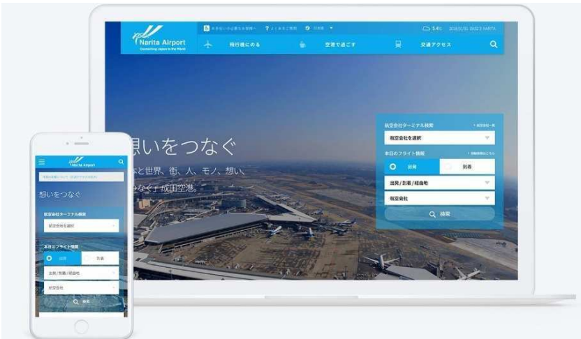
팀랩이 제작한 나리타공항의 홈페이지 및 앱